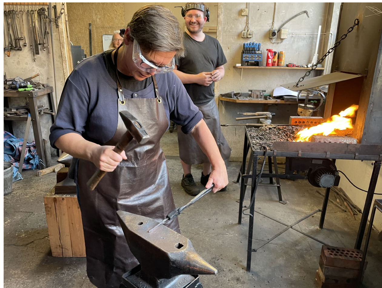
I smia på Hjerleid.