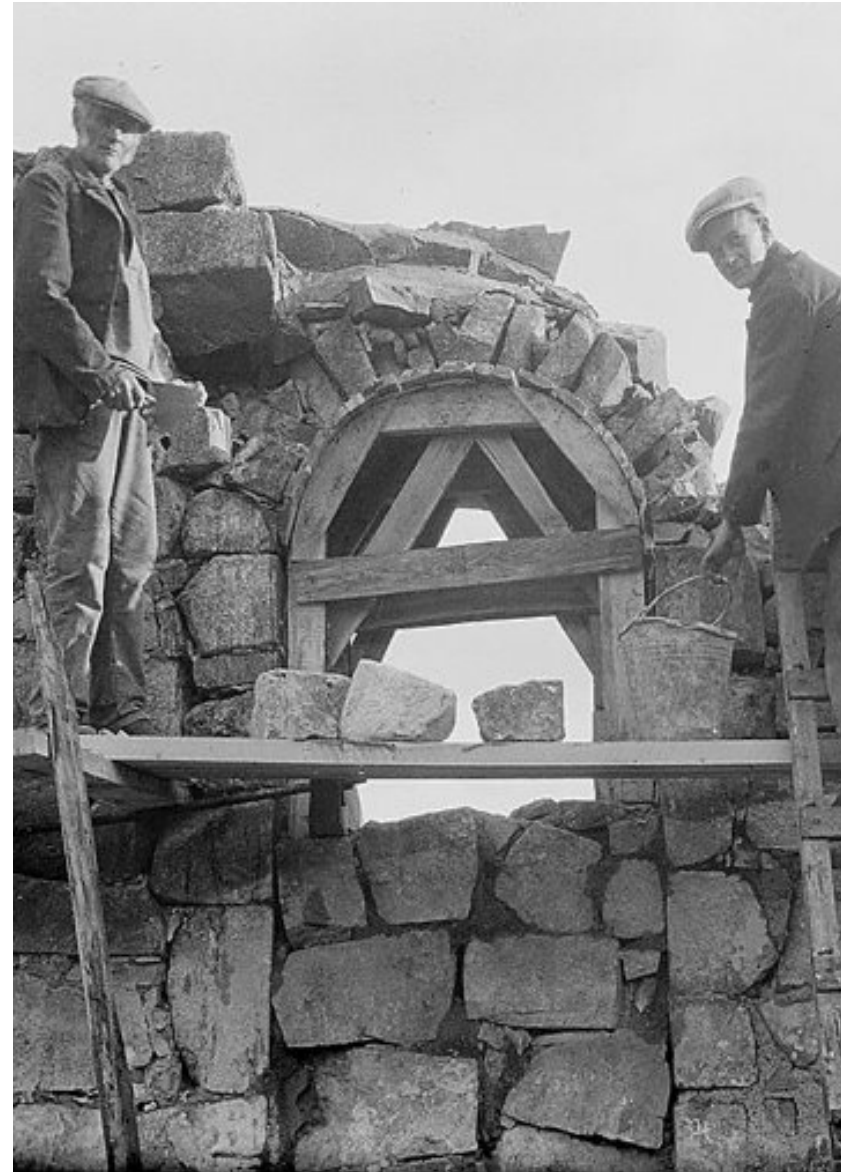
Restaureringen av Holla kirkeruin 1923-25.