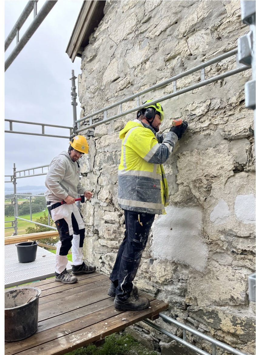
Sakshaug gamle kirke – murerkurs.